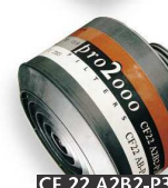
CF 22 A2B2-P3