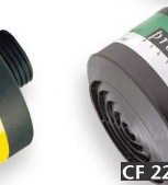
CF 22 K2-P3