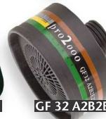
GF 32 A2B2E2K2