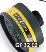
GF 32 E2