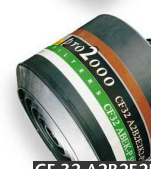
CF 32 A2B2E2K2-P3