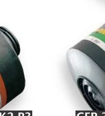
CFR 32 A2B2E2K2-P3