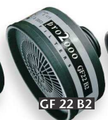
GF 22 B2