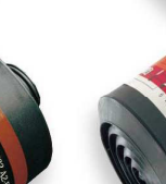
CF 32 Reactor-Hg-P3