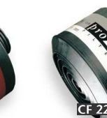
CF 22 B2-P3