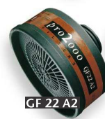
GF 22 A2