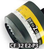
CF 32 E2-P3