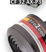
CF 22 A1E1Hg-P3