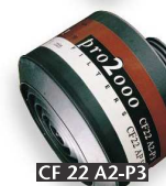
CF 22 A2-P3