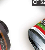
CF 32 A2B2E2K2-Hg-P3