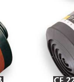
CF 22 A2B2E1-P3