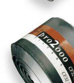
CF 32 AX-P3