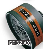
GF 32 AX