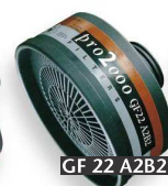
GF 22 A2B2