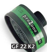
GF 22 K2